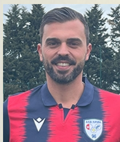
Cento Stefano Difensore